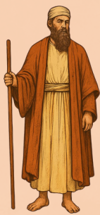
כָּל עַם יִשְׂרָאֵל