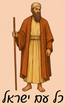
לא עם ישראל